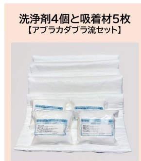
アンサンブル・パッケージ