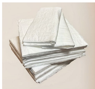
油カダブラ・GTプロシート